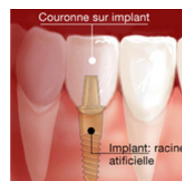
Prothèse sur implant

Le choix d'une prothèse s'effectue en concertation avec votre praticien